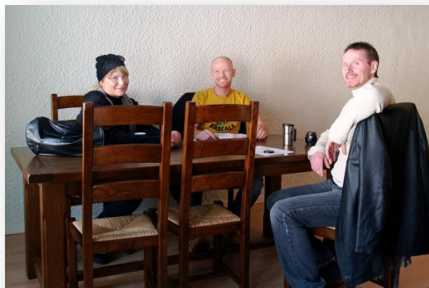
Første møte i planleggingsgruppa

Våren 2008 gikk to representanter fra MARBORG sammen med en representant fra Tromsø kommune, Rus og psykiatritjenesten, der målet var å utarbeide en projektskisse for et brukerstyrt bo og oppfølgingstilbud i kommunens noe nedslitte hybelhus i Ryav. 37.